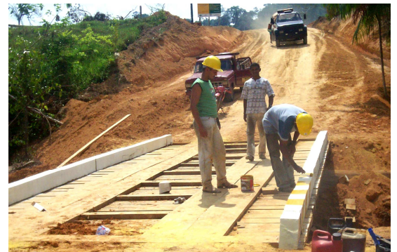
Acordo permite retomada de obras nos PA's

O Instituto Nacional de Colonização e Reforma Agrária (Incra) e a Secretaria Estadual de Meio Ambiente (Sema) assinaram no dia 27 de maio, em Belém (PA), um Termo de Ajustamento de Conduta (TAC) que objetiva a execução do licenciamento ambiental nos projetos de assentamento federais no Estado do Pará. O documento foi assinado pelas três Superintendências do Incra no Pará, que possuem sedes em Belém, Santarém e Marabá.